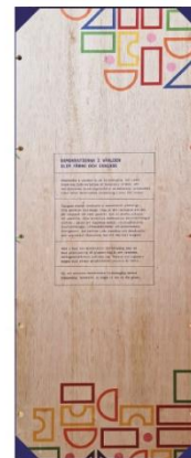
Demokratin är på tillbakagång. Idag lever bara 13 procent av världens befolkning i helt fria demokratier.