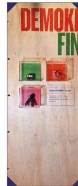
Tre föremål som hör ihop med varsin demokratiberättelse.