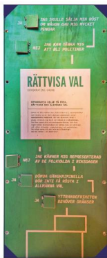
Beskrivningar av V-Dem:s fem demokratibegrepp: rättvisa val, frihet, jämlikhet, öppenhet och deltagande.