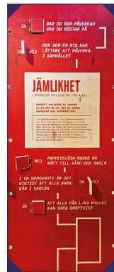
Genom att ta ställning till olika frågeställningar fördjupas förståelsen för de olika demokratibegreppen.