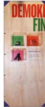
Tre föremål som hör ihop med varsin demokrati-berättelse.