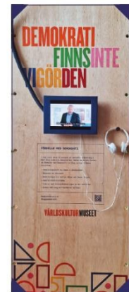
Intervju med Staffan Lindberg, föreståndare för V-Dem, som förklarar hur demokratin mår idag.