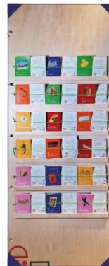
Vykort att ta med hem. 18 personliga demokrati-berättelser ifrån olika platser i världen.