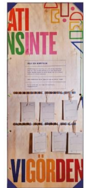
Här kan du skriva din egna demokratiberättelse på en lapp och hänga upp den på väggen för att dela med andra.