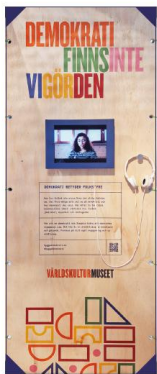
Filmade personliga berättelser om demokratiskt engagemang från olika delar av världen.