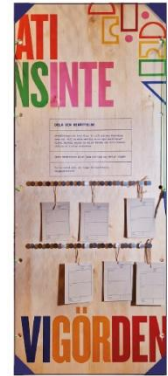
Här kan du skriva din egna demokrati-berättelse på en lapp och hänga upp den på väggen för att dela med andra.