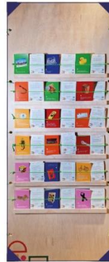
Vykort att ta med hem. 18 personliga demokrati-berättelser ifrån olika platser i världen.

Om tid finns, avsluta med att låta eleverna skriva en egen berättelse och hänga upp.