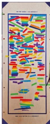
Här kan du med hjälp av tejp och en penna berätta vad mer du tycker behövs i en demokrati.